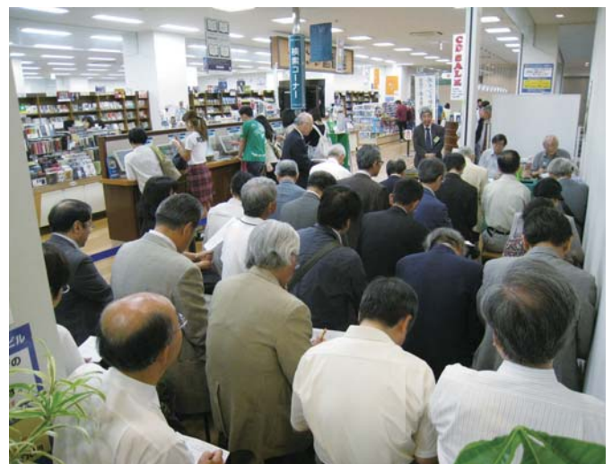
OMUPサロン当日の様子